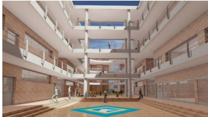
Imagen del edificio de aulas terminado según diseño.