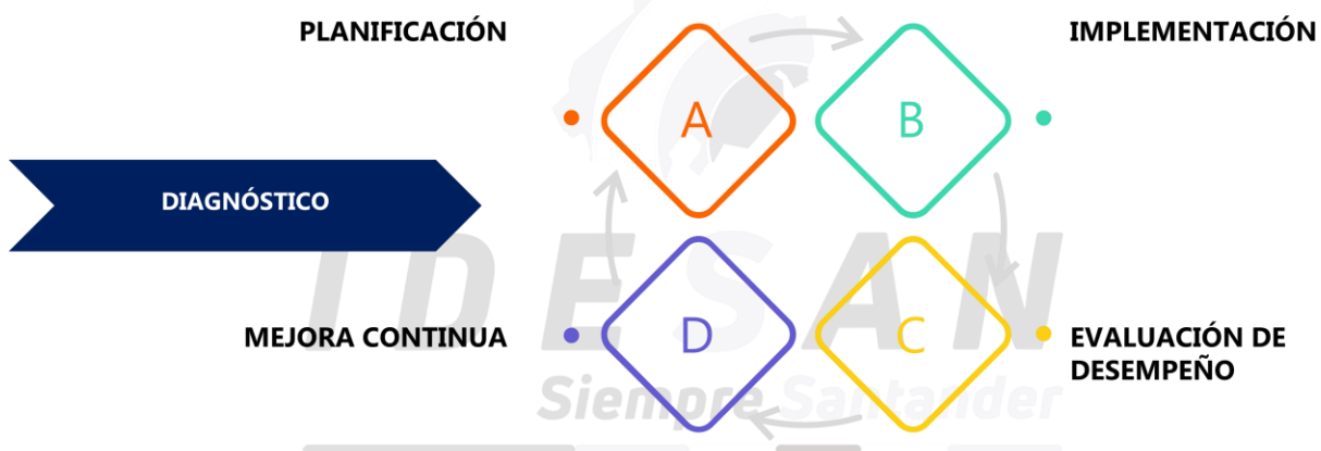
Figura 1. Ciclo de operación del MSPI

Diagnóstico: En esta etapa se identifica el estado actual de la entidad respecto a los lineamientos y requerimientos del MSPI.