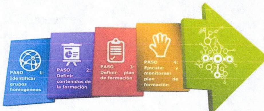
Ilustración 1. Pasos para estructurar el esquema de formación

La estrategia de uso y apropiación define el plan de formación con base en la estructura definida en la guía de MinTIC (Ilustración 1) y con el propósito de facilitar la apropiación de tecnologías de información en el IDESAN, para que los colaboradores cuenten con las competencias necesarias para utilizar los servicios resultantes de la iniciativa de TI. En esta actividad se fortalecen habilidades, capacidades, herramientas y/o procesos.